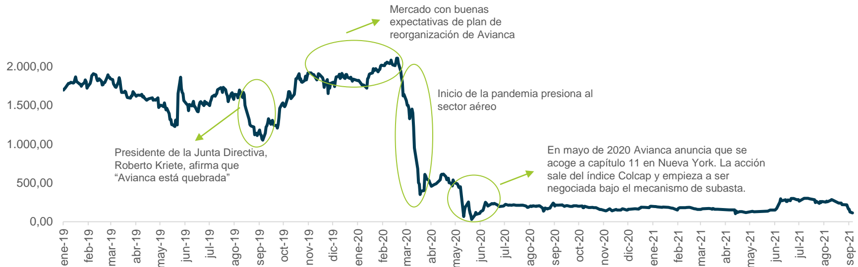
Gráfica 2. Evolución del precio de Pref. Avianca (COP/Acción)

Cabe resaltar que, de acuerdo con la distribución accionaria de Avianca Holdings S.A. (gráfico 1), BRW Aviation LLC, propiedad de Synergy Group (que pertenece al empresario Germán Efromovich) ostenta la mayoría de participación en la compañía (51,53%), seguida de los accionistas preferenciales (34,01%) y Kinsgland Holdings Limited (14,46%), propiedad de Roberto Kriete.