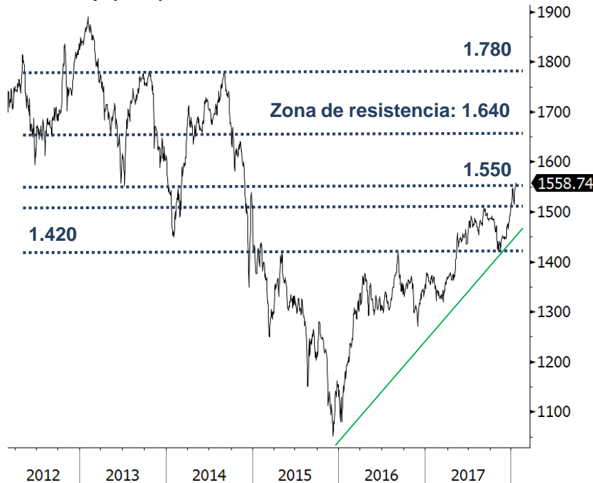
1. Colcap (CdB)