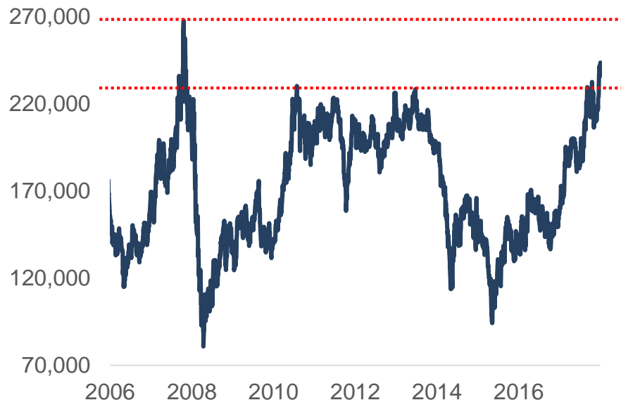
Petróleo Brent en Pesos Colombianos