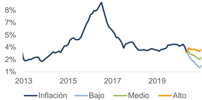
Tabla de frecuencia IPC mensual histórico