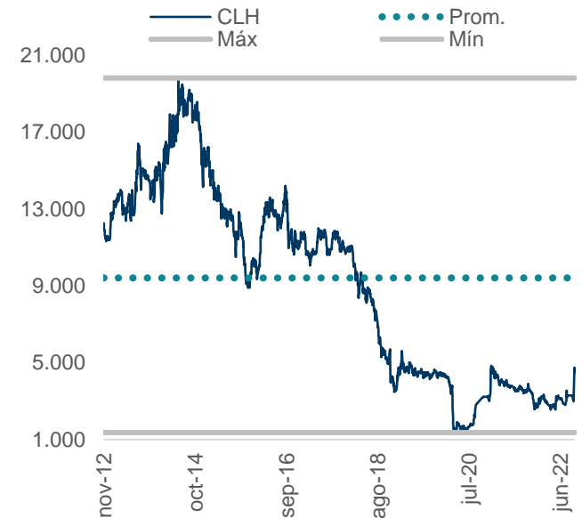
Gráfico 1. Desempeño bursátil CLH