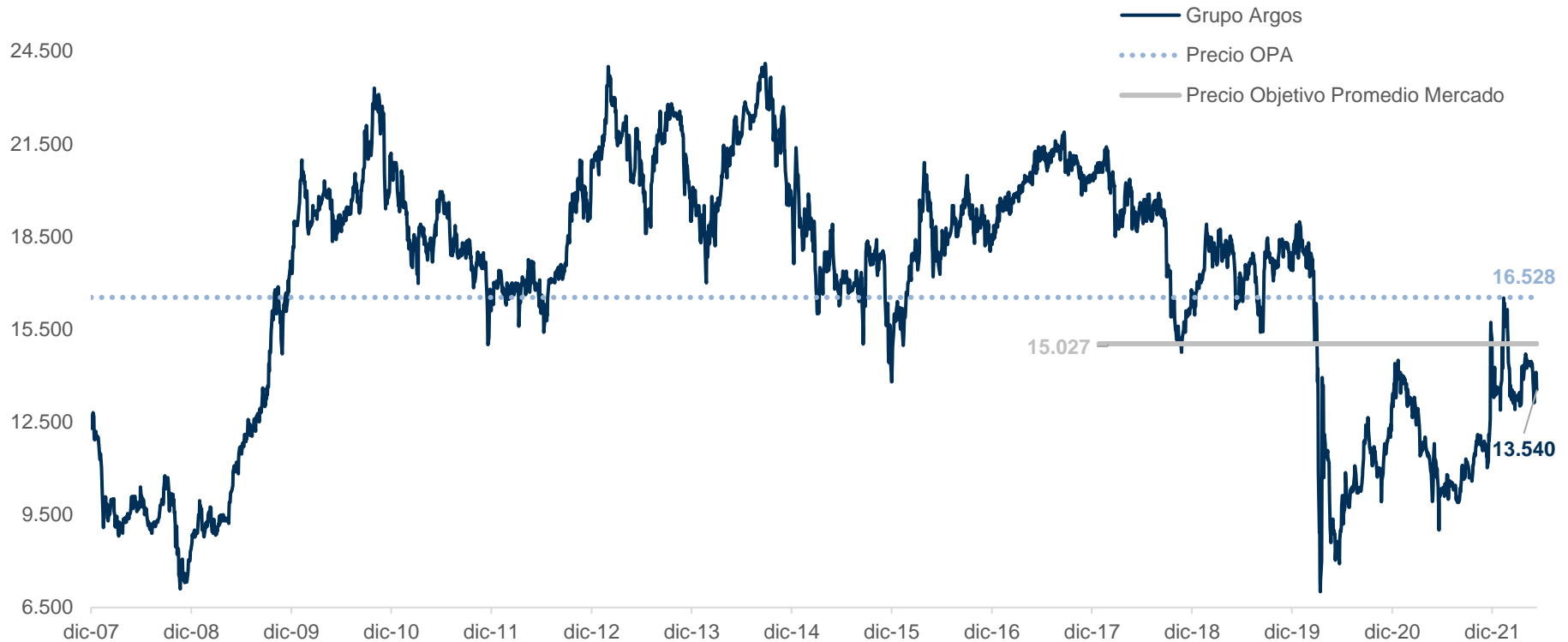
Gráfico 2. Histórico cotización Grupo Argos

El precio de Grupo Argos ha enfrentado presiones alcistas en medio del contexto de las tres rondas de OPAs por Grupo Sura y Grupo Nutresa, que dieron inicio a finales del año 2021. Considerando la TRM vigente al 20 de mayo de 2022, el precio de la oferta es superior al último precio registrado antes del anuncio (22,1%). Además, el precio contempla una prima de 10% frente al precio objetivo promedio 12M del consenso del mercado de Bloomberg. Por otro lado, es importante mencionar que, si bien las negociaciones del activo se mantienen suspendidas hasta la publicación de la oferta, podríamos esperar un impulso alcista una vez se reactiven las operaciones.