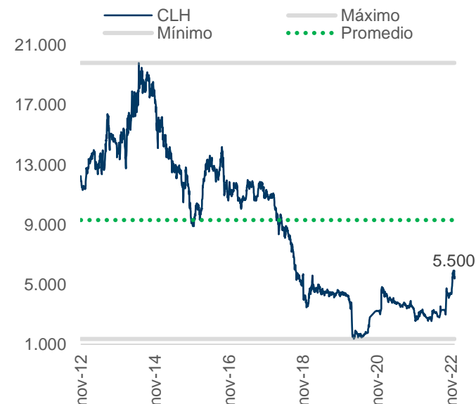
Gráfico 1. Desempeño bursátil CLH

Fuente: Bloomberg. Elaboración: Casa de Bolsa S.C.B.