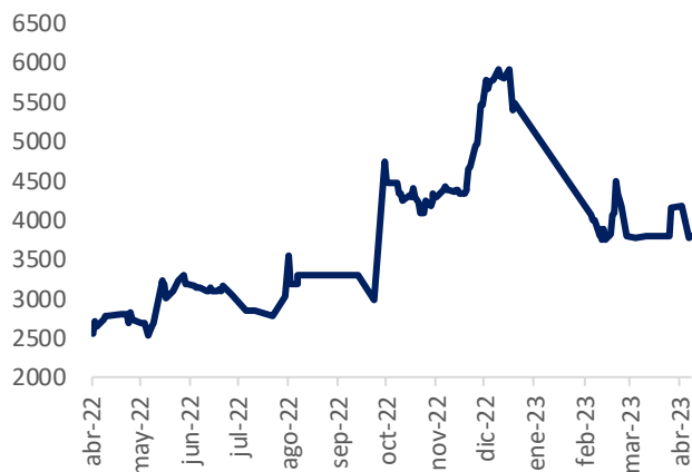
Gráfica 1. Precio acción CLH

Fuente: BVC. Cálculos: Casa de Bolsa SCB.