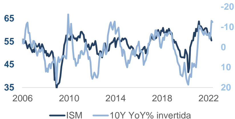
ISM vs variación anual S&P 500