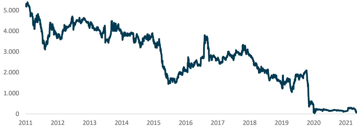
Gráfico 1. Evolución histórica precio PFAVH